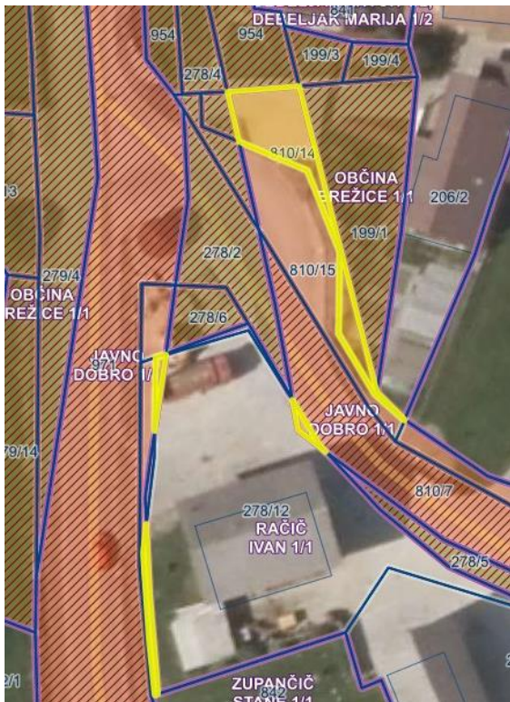
Grafični prikaz k.o. Gabrje