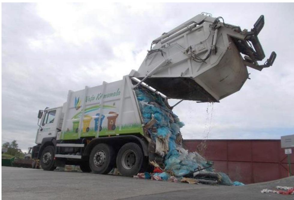
Slika 1: Zbiranje določenih vrst komunalnih odpadkov

Zbiranje odpadkov od vrat do vrat je organizirano za mešane komunalne odpadke, biološke odpadke in odpadno embalažo iz plastike, kovin in sestavljenih materialov in poteka v skladu s koledarjem.