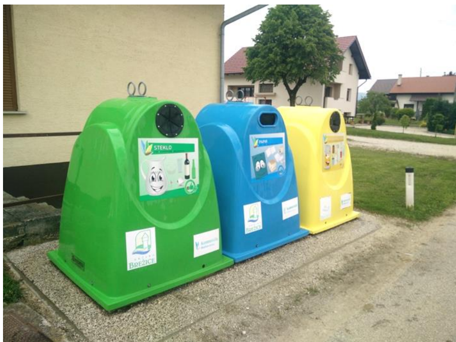
Slika 2: Primer ekološkega otoka v občini Brežice

Nevarne odpadke iz gospodinjstev zbiramo 2 x letno v premični zbiralnici nevarnih odpadkov, in vse leto v Zbirnem centru Boršt. Uporabniki lahko tovrstne odpadke oddajo tudi v Zbirnem centru Boršt.