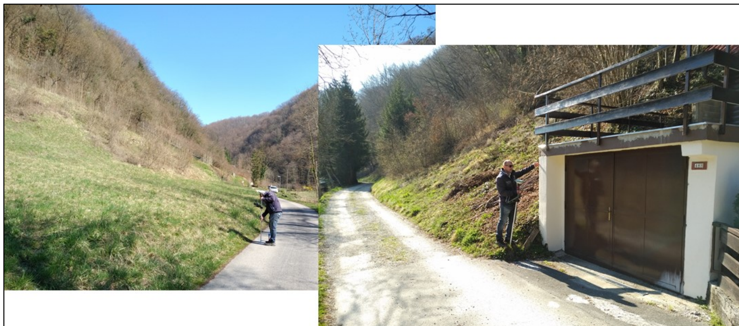
Slika 1. Izvedba geodetskih meritev na terenu.