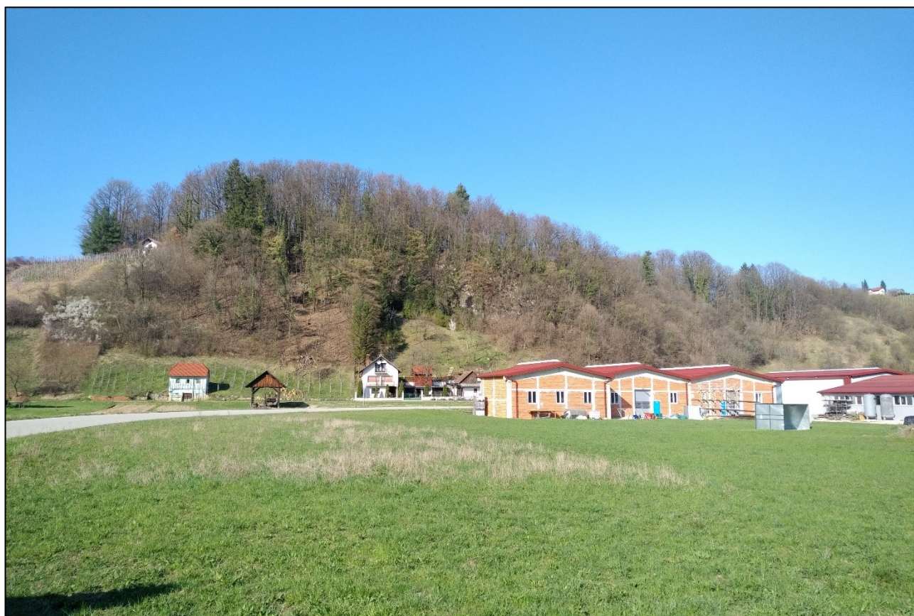
Slika 2. Območje obdelave, kjer je prišlo do skalnega podora.