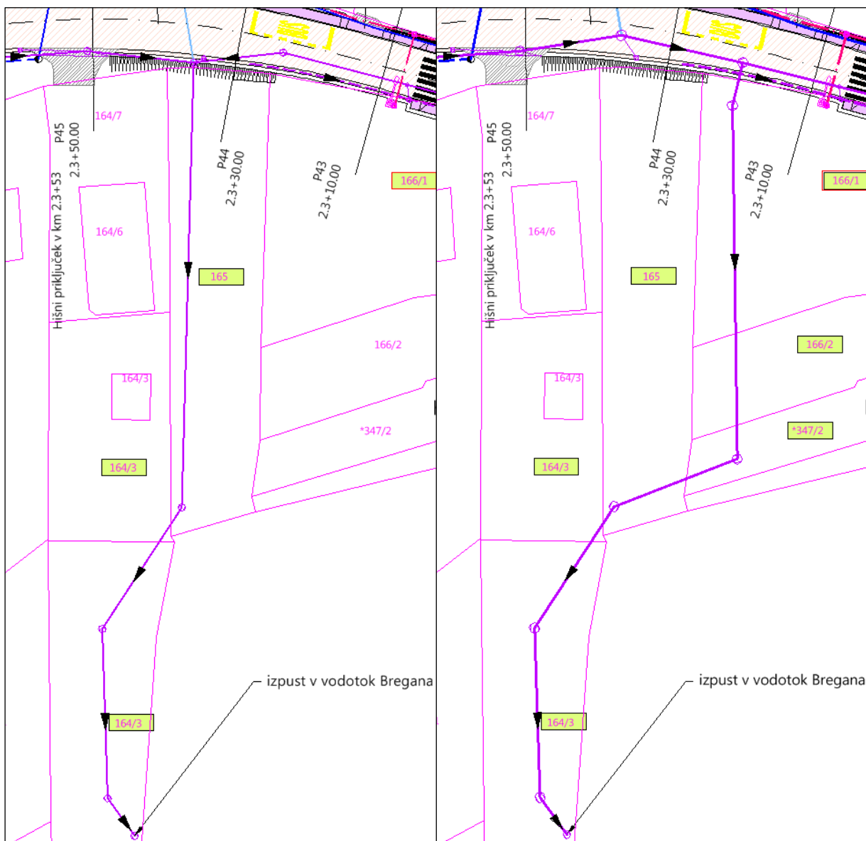
Slika 1 : prikaz poteka trase na zemljiškem katastru pred spremembo (levo) in po spremembi (desno)

Zaradi nestrinjanja lastnice zemljišča št. 165 k.o. Nova vas, s predvidenim potekom padavinskega kanala, je bilo potrebno spremeniti traso le tega. Trasa padavinskega kanala P3 je tako prestavljena na sosednje zemljišče.