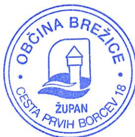
Ivan Molan Župan Občine Brežice

Zaradi potreb po spremembah pri nekaterih proračunskih postavkah, ki jih ni bilo možno odpraviti z prerazporeditvami, je bil Občinskemu svetu predlagan Odlok o rebalansu proračuna Občine Brežice za leto 2022, ki je bil tudi sprejet na 24. seji Občinskega sveta z dne 7.7.2022. V kolikor bomo smatrali, da do konca letošnjega leta ne bo prišlo do realizacije prihodkov v predvideni višini, bo potrebno s sprejetjem novega rebalansa uskladiti proračun tako, da se opravijo ustrezne korekcije na področju tekoče porabe, kakor tudi v investicijskem delu proračuna.