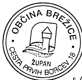
Ivan Molan, župan občine Brežice

Za spremljanje izvajanja letnega programa je pristojen imenovani strokovni svet za področje kulture Občine Brežice.